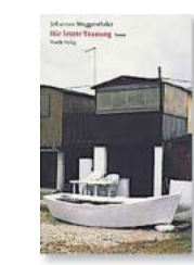
Johannes Muggenthaler: „Die letzte Trauung“. Roman.

Doch es gibt auch manches Hübsche und Milieusichere in diesem Buch. Muggenthaler hat – dies zeigen schon die dem Roman beigegebenen Fotografien – einen Sinn für detailgesättigte Genreszenen, und wenn er ein heruntergekommenes Landgasthaus beschreibt, dann glaubt man es förmlich riechen zu können. Auch seine kleinstädtischen Milieustudien sind präzise aufgenommen. Nur steht es schlecht um die erzählerische Ökonomie; die ohnehin kaum tragfähige Geschichte wird redundant erzählt und mit sie kaum vorantreibenden Episoden aus der Provinz ausgestattet. Hinzu kommen die stilistischen Mängel und erzählerischen Nachlässigkeiten des Buches, die den Leser verstört nach der Rolle des Lektorats fragen lassen. Es mag ja sein,