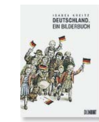
Isabel Kreitz: „Deutschland“. Ein Bilderbuch.

Deutschland liest: Aus der Bildersgeschichte zur Ausgabe des „Stern“ vom 6. Juni 1971 mit dem Bekenntnis von 374 Frauen, abgetrieben und damit gegen den Paragraphen 218 verstoßen zu haben.