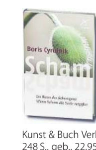
Boris Cyrulnik: „Scham“. Im Bann des Schweigens. Wenn Scham die Seele vergiftet.

wie aus einem Erdloch? Cyrulnik unterscheidet Bedingungen, die ein Kind oder Erwachsener mitbringt, Bedingungen, die in der Form des beschämenden Erlebnisses liegen, und Bedingungen der sozialen Unterstützung danach. Zur Gruppe der zuerst genannten Bedingungen können körperliche Eigenschaften gehören, aber auch genetische „Tendenzen“, von denen in der Traumaforschung der letzten Jahre viel die Rede war, erhalten allen-